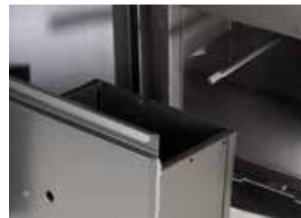
CAPIENTE CASSETTO CENERE Large ash pan Grand tiroir à cendres Großer aschekasten Cajón de cenizas amplio Grote aslade