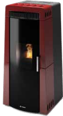
TRIESTE BORDEAUX LUCIDO