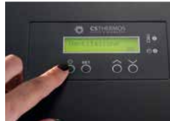
PROGRAMMAZIONE SETTIMANALE Weekly timer Programmation hebdomadaire Wochenprogrammierung Programación semanal Weekprogramming