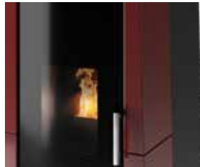
VETRO PANORAMICO CURVATO Curved panoramic glass Verre panoramique bombé Gewölbtes panoramaglas Vidrio panorámico curvo Gebogen panoramisch glas

Attractive and adaptable to all needs. Beau a regarder et adaptable a tout besoin. Formschöne ästhetik und für jeden bedarf zugeschnitten. Bonita y adaptable a cada necesidad. Stijvol design en geschikt voor elke behoefte.