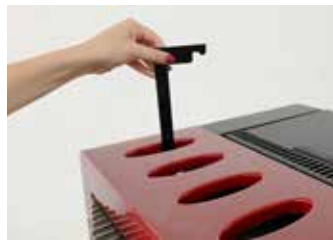
SEMPLICE PULIZIA DEGLI SCAMBIATORI Easy-to-clean heat exchangers Simplicité de nettoyage des échangeurs Reinigungsfreundliche wärmetauscher Limpieza sencilla de los intercambiadores Eenvoudige reinig van de warmtewisselaars

Simplified ordinary maintenance Entretien de routine simplifié Einfache planmäßige wartung Mantenimiento ordinario simplificado Eenvoudig standaardonderhoud