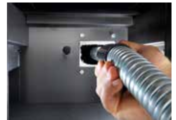
FACILE PULIZIA TUBO SCARICO FUMI Easy-to-clean exhaust Facilité de nettoyage du conduit d'évacuation Leichte reinigung der abgasführung Limpieza fácil del tubo de evacuación de los humos Gemakkelijke reiniging rookgasafvoer