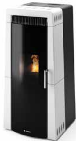
TRIESTE PERLA LUCIDO

Het ronde "magische" glas, dat het innovatieve en moderne design van de TRIESTE kachel kenmerkt, weerspiegelt de energie van het vuur met zijn licht en warmte in huis. De vervulling van de esthetische wensen van de klanten, en tegelijkertijd de prestaties van de producten verzekeren, is een reden voor tevredenheid en continu onderzoek.