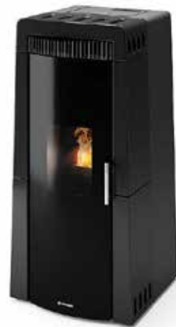
TRIESTE NERO LUCIDO