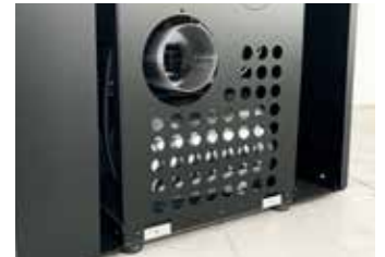
USCITA FUMI ORIZZONTALE O VERTICALE Horizontal or vertical flue gas outlet Evacuation des fumées horizontale ou verticale Horizontale oder vertikale abgasführung Salida de humos horizontal o vertical Horizontale of verticale rookgasafvoer