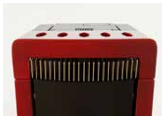
VENTILAZIONE FRONTALE SILENZIOSA Silent front ventilation Ventilation frontale silencieuse Geräuscharme vordere Lüftung Ventilación frontal silenciosa Geluidsarme ventilatie aan de voorkant

Trieste hermetic stove. Poêle étanche Trieste. Trieste hermetischer ofen. Estufa estanca Trieste. Trieste hermetische kachel.